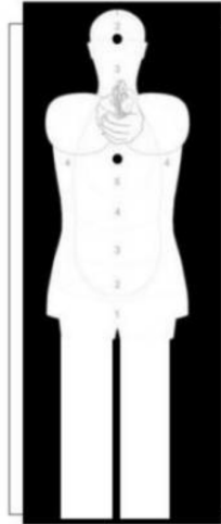
Imagem 1: Extraído da NT-SENASP nº 002/2020 – AINM. Alvo para ENSAIO DE ENDURANCE E PRECISÃO.

2.3.8.2. O alvo atenderá o modelo exigido pela norma “NT-SENASP nº 002/2020 – Arma Eletroeletrônica de Incapacitação Neuromuscular – AINM”.