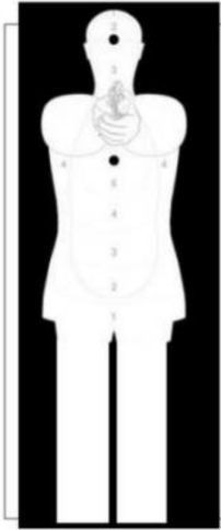
Imagem 1: Extraído da NT-SENASP nº 002/2020 – AINM. Alvo para ENSAIO DE ENDURANCE E PRECISÃO.