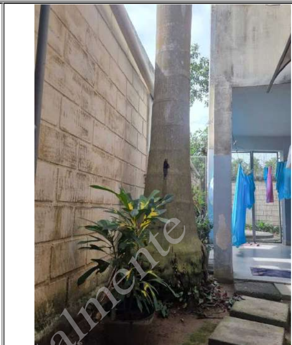
Imagem 02: Base da palmeira com marcas de decrepitude.