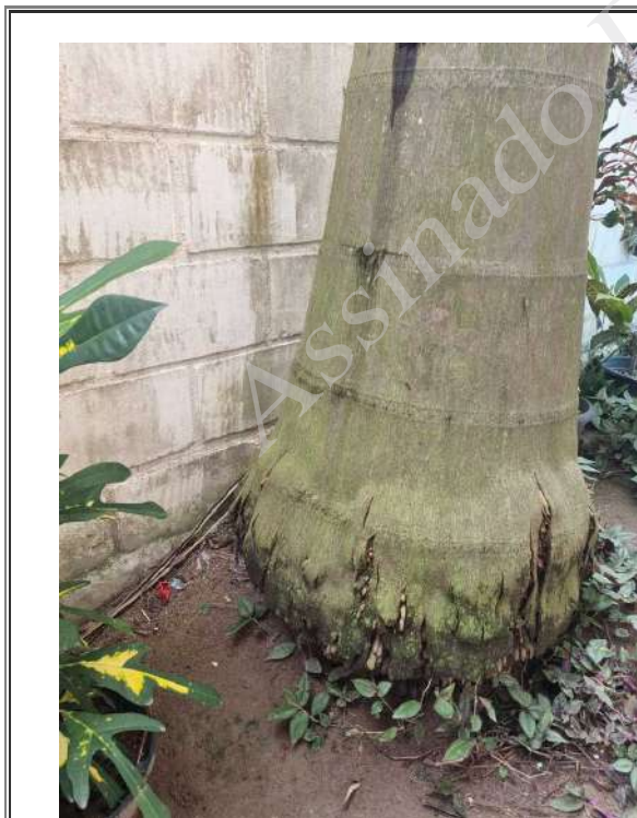
Imagem 03: Trincas na base.