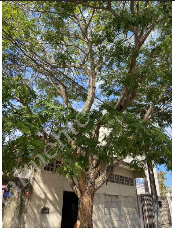
Imagem 02: Árvore autorizada o corte.