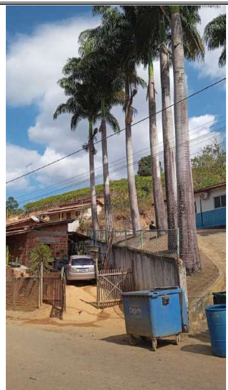
Imagem 03: Proximidade das palmeiras