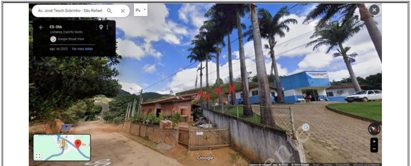
Imagem 01: Imagem de satélite para facilitar a localização das referidas palmeiras e destaque para os X em vermelho, que sinalizam quais palmeiras devem ser retiradas (4). Optamos por manter duas delas, pois essas não estão alinhadas com a residência, configurando logradouro público (calçada/rua).