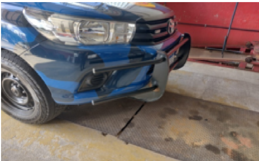
Figura 02: Para-choque de impulsão Figura ilustrativa.