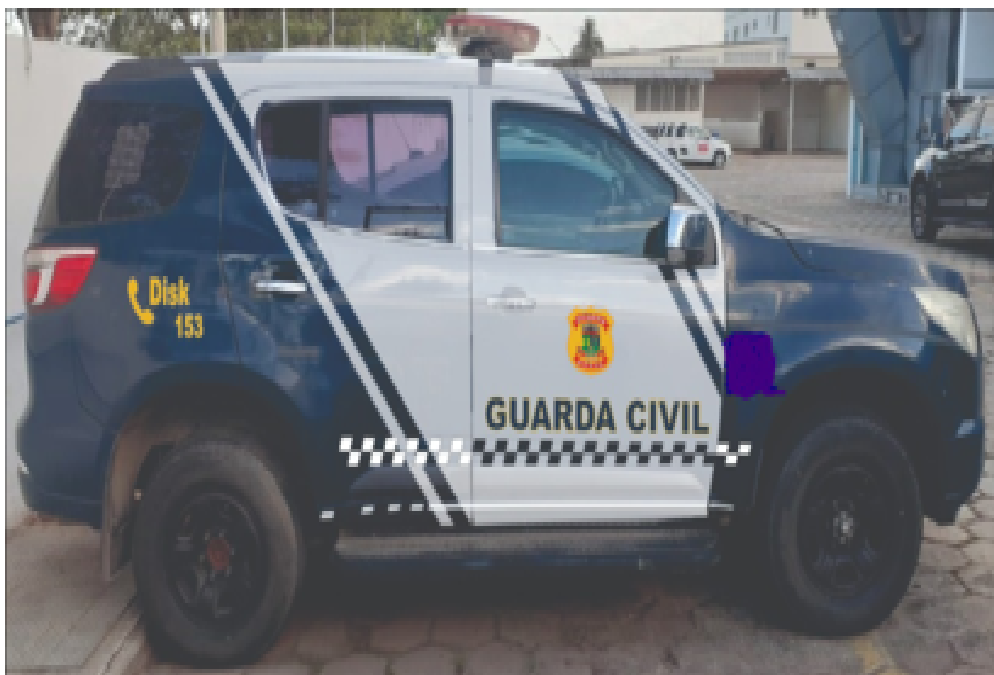
Figura 03: Modelo Grafismo da Guarda Civil Municipal, Figura ilustrativa

2.1.1 Veículo na cor azul noite (padrão da Guarda Civil Municipal de Linhares), pintado com faixas brancas e azuis, no padrão definido pela Guarda Civil Municipal de Linhares. Além disso, faz parte do padrão definido pelo Grafismo da Guarda Civil Municipal de Linhares – GCML, outros tipos de plotagens, observando-se que sob demanda haverá quantidade de pintura de viaturas das Tropas Especializadas (diversos tipos de camuflado, bem como outras formas de grafismo também).