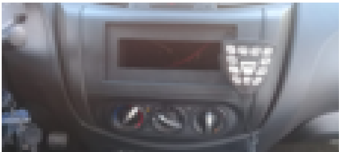
Figura 18: sugestão de módulo de controle

O Módulo de controle deverá ser dotado de cabeça de controle remota, compacta, integrada ao "mike", com tamanho adequado que permita o manuseio e acionamento utilizando uma das mãos, com cabo espiralado de tamanho suficiente que alcance as portas laterais, a ser instalado no painel frontal do veículo por meio de presilha magnética, com a finalidade de controlar, de forma integrada, todo o sistema de sinalização acústico e visual da viatura, dotado de micro processador ou controlador que permita a geração de lampejos luminosos de altíssima frequência, com ciclo não inferior a 04 (quatro) flashes a cada 100 m, deverá possuir no máximo 15 botões para acionamento das funções, com as inscrições na língua Portuguesa, sistema de megafone com ajuste de ganho, com interligação auxiliar de áudio com o rádio transceptor;