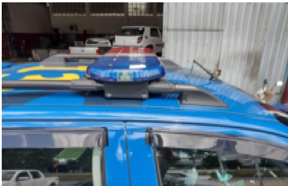
Figura 01: Bagageiro de teto original, ou barra instalada, figura ilustrativa