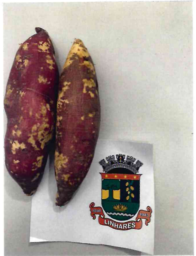
29 BATATA DOCE