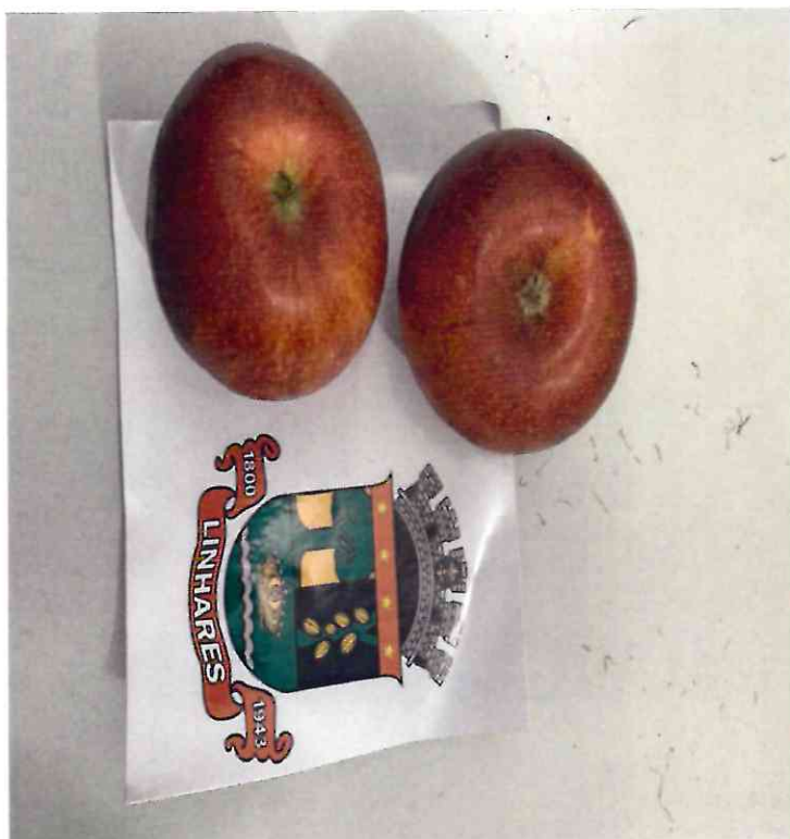
23 MAÇÃ NACIONAL