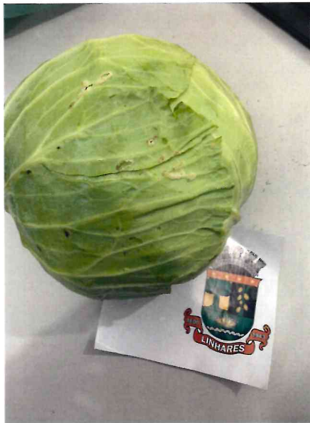
18 REPOLHO BRANCO