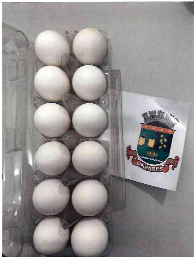
29 OVOS DE GRANJA BRANCO