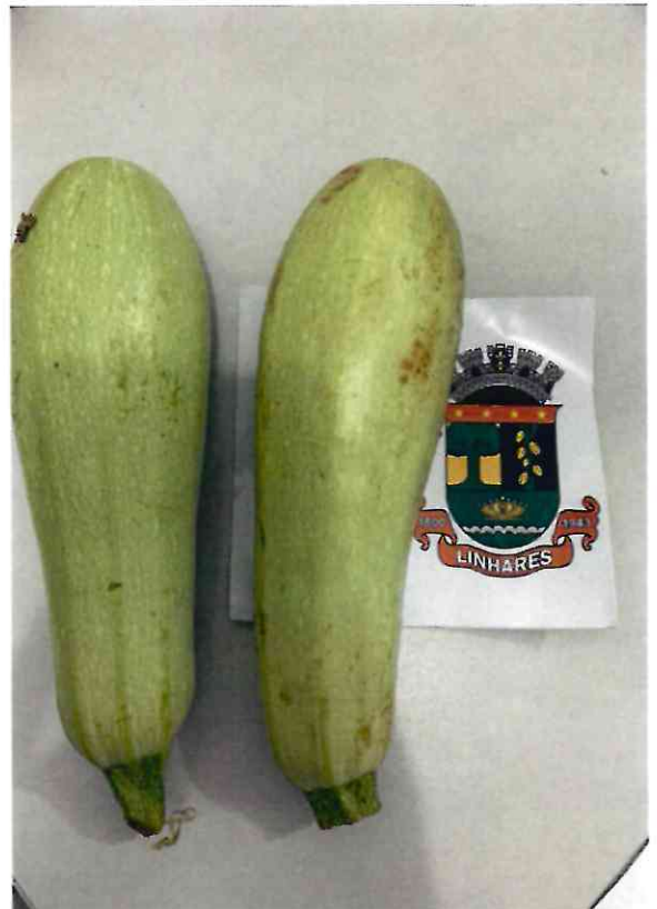
30 ABOBRINHA ITALIANA