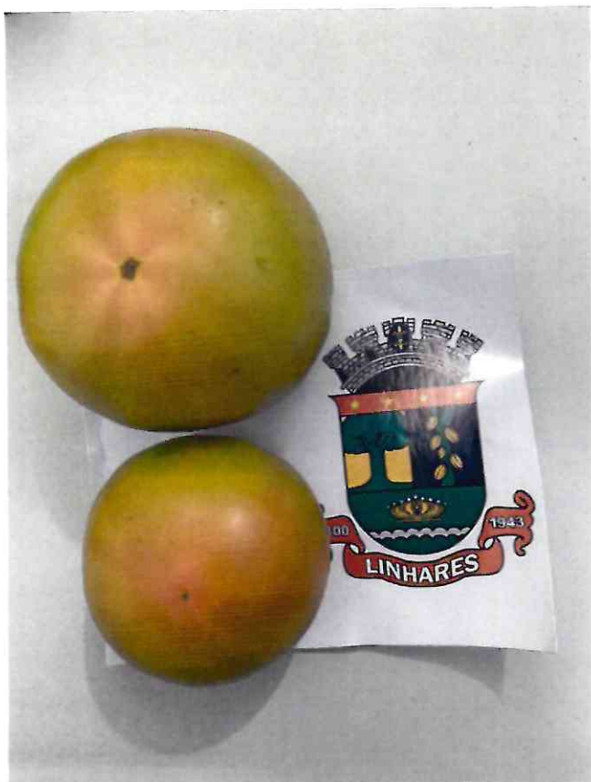
6 TOMATE TAMANHO MÉDIO