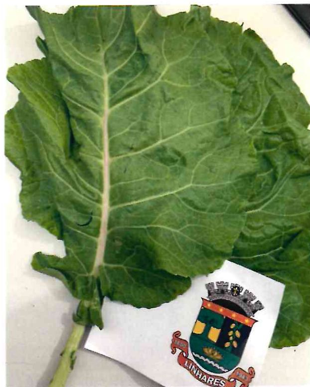
3 COUVE MANTEIGA