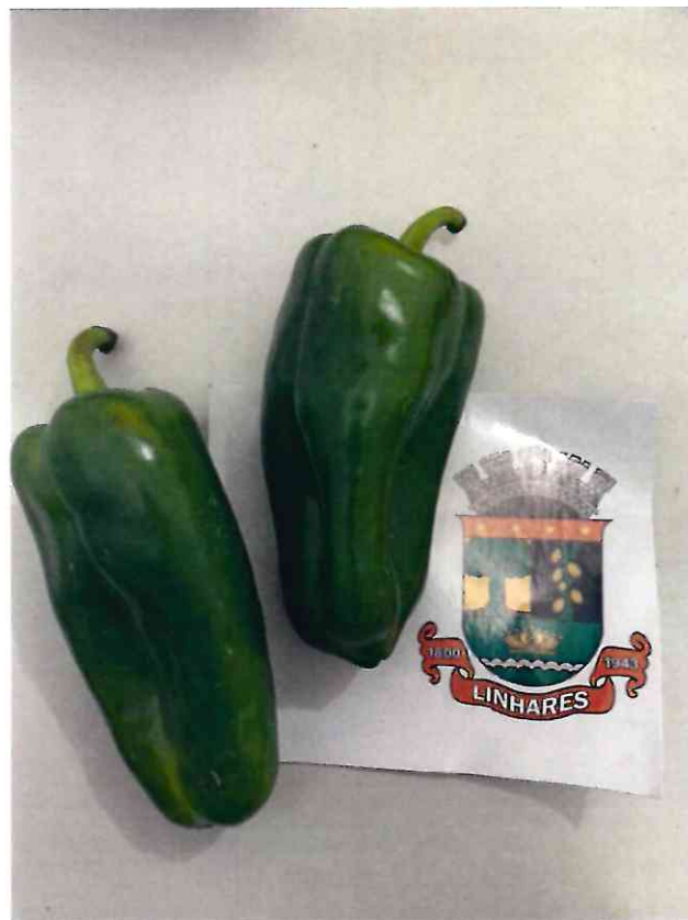
8 PIMENTÃO VERDE