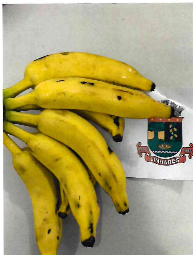
22 BANANA PRATA