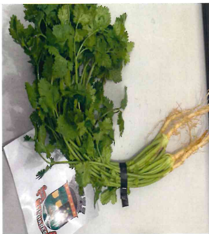
16 COENTRO FRESCO