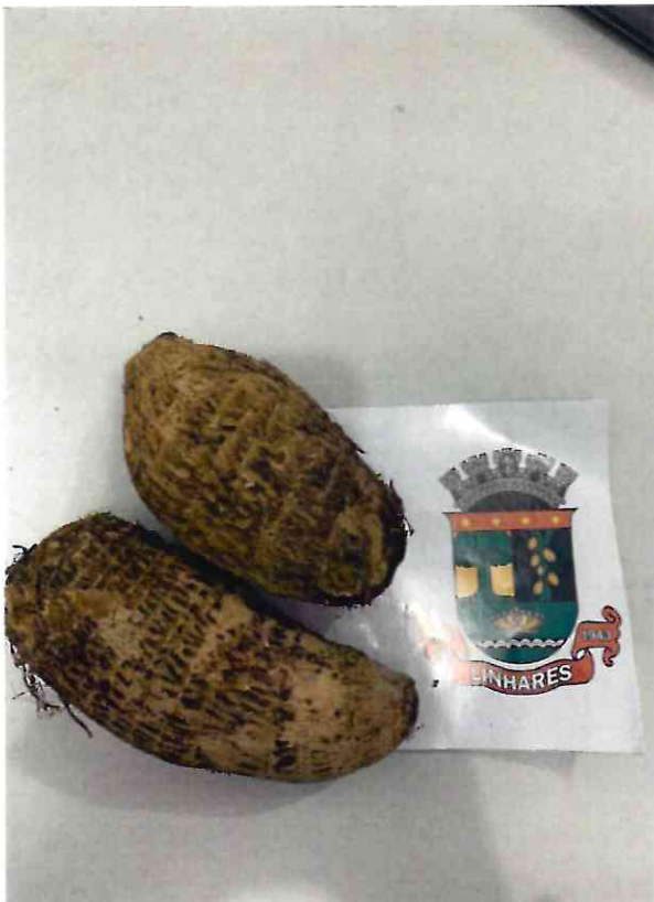
12 INHAME DEDO