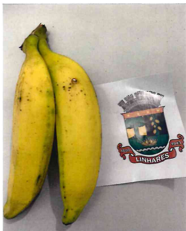
2 BANANA DA TERRA