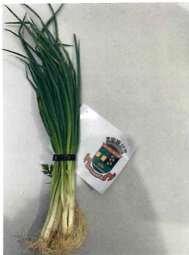
14 CEBOLINHA VERDE