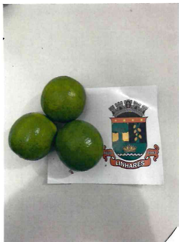
31 LIMÃO TAITI