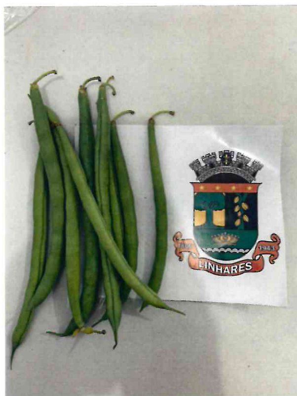
09 VAGEM FRESCA