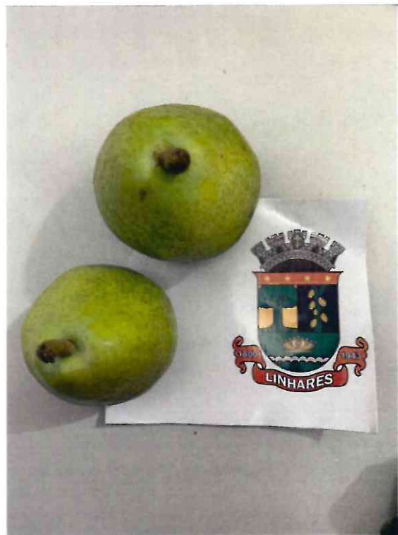
25 PERA NACIONAL