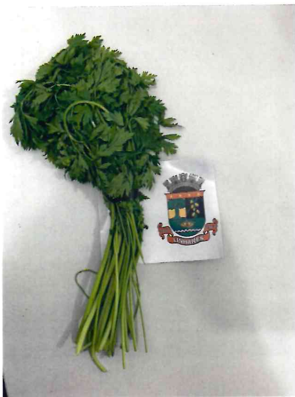
15 SALSA FRESCA