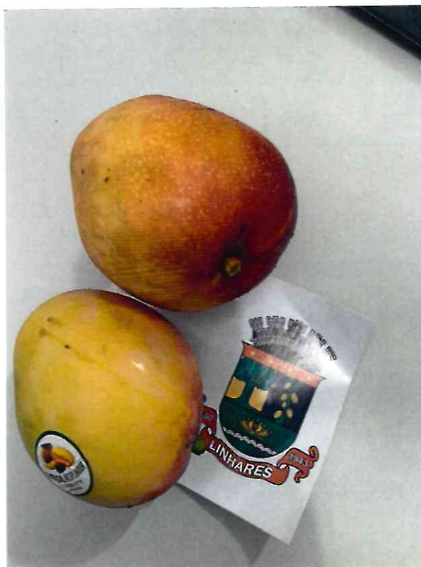
35 MANGA TAMANHO MÉDIO