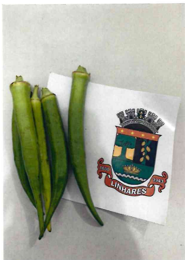
21 QUIABO VERDE