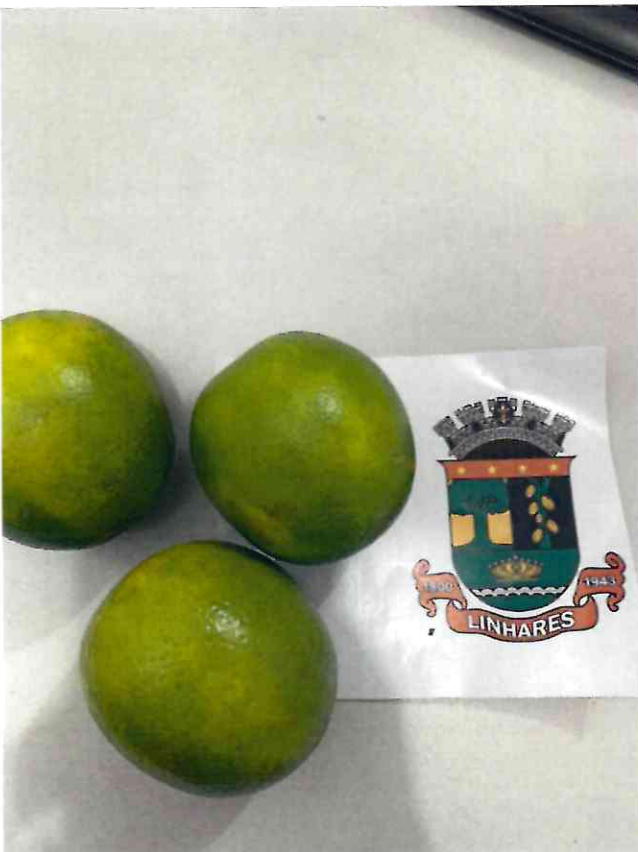
24 LARANJA PERA