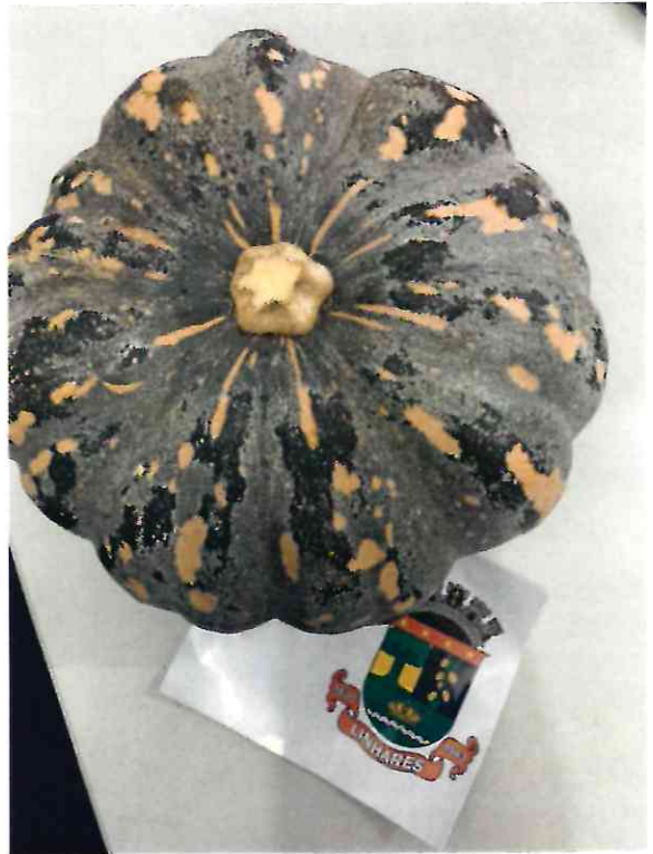
13 ABÓBORA MADURA