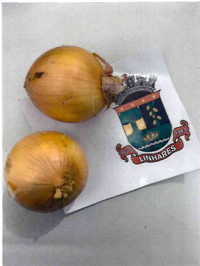
7 CEBOLA BRANCA