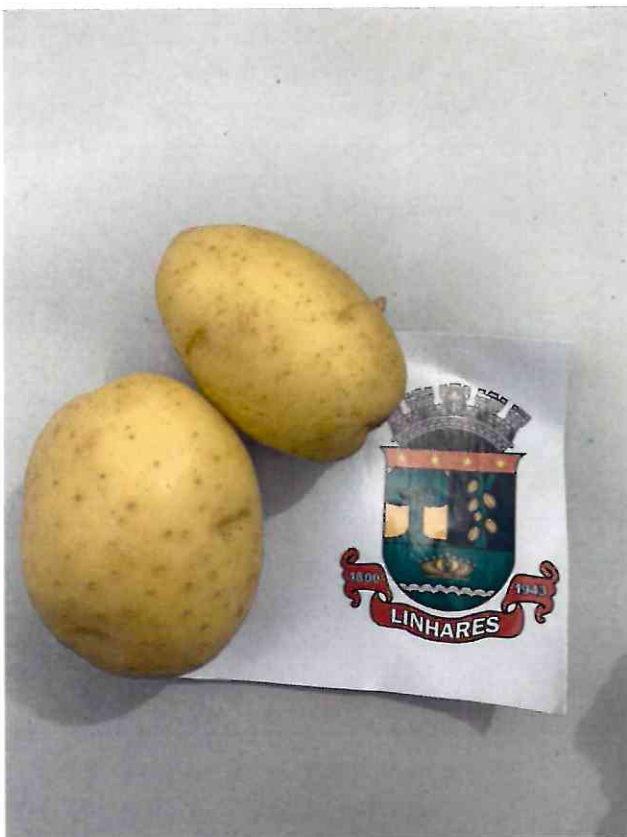
10 BATATA INGLESIA