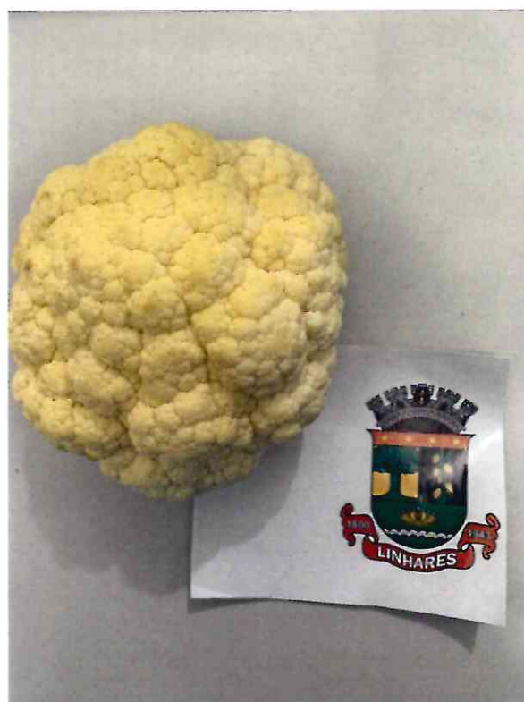
20 COUVE FLOR