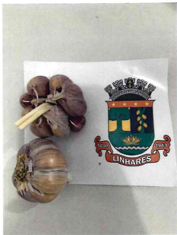
01 ALHO IMPORTADO