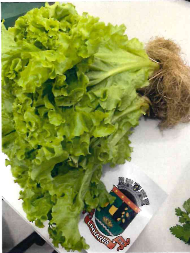
4 ALFACE CRESPA