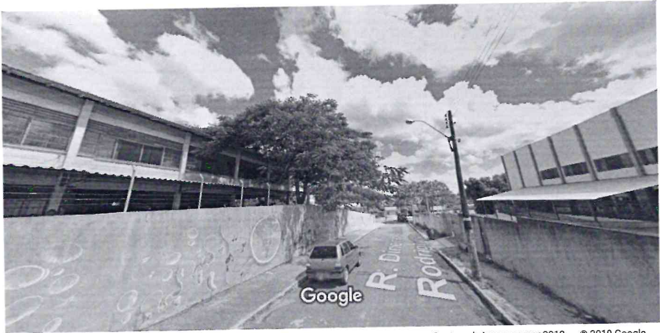
Captura da imagem: mar 2012